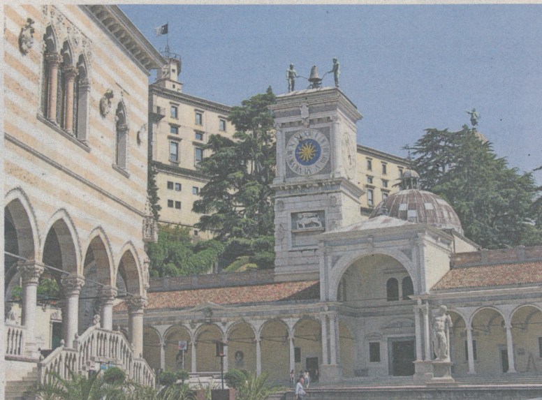
La Arlef e à ospitât a Udin il tierç incuintri dal progjet Interreg dedicât ai teritoris cun minorancis linguistichis. >> DI CHRISTIAN ROMANINI